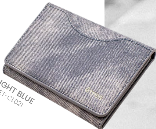
LIGHT BLUE ET-CL021