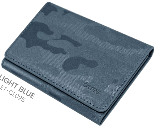
LIGHT BLUE ET-CL025