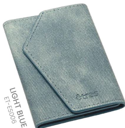
LIGHT BLUE ET-ES006