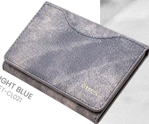
LIGHT BLUE ET-CL021