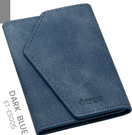
DARK BLUE ET-ES005