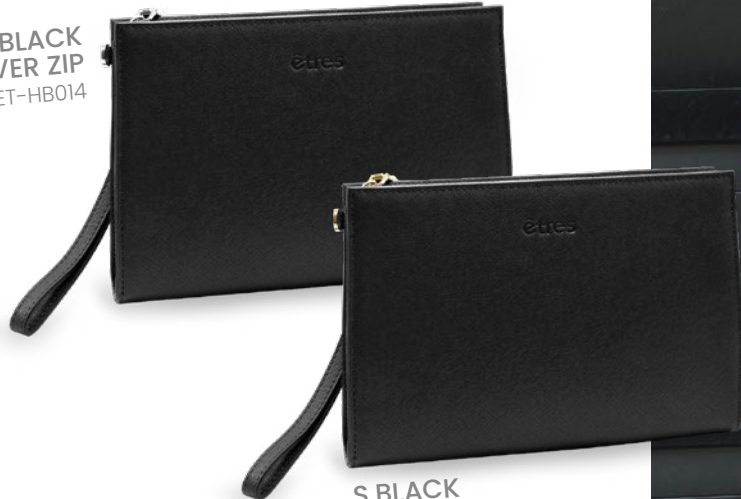
S.BLACK GOLD ZIP ET-HB007