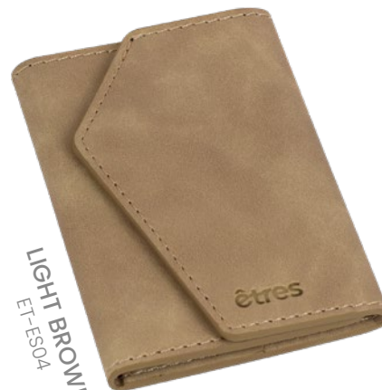
LIGHT BROWN ET-ES04