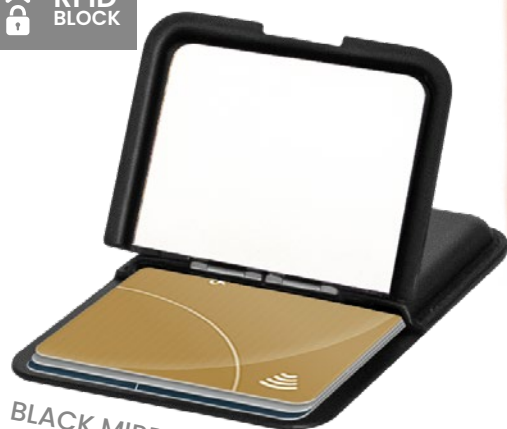
BLACK MIRROR ET-PC002