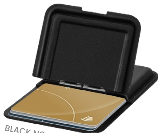
BLACK NO MIRROR ET-PC003